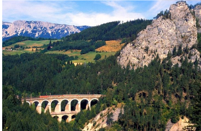
Viadukt „Kalte Rinne“

Die Semmeringebahn zeigt eine ausgezeichnete technologische Lösung für die Hauptproblematik früher Schienenwege und ließ eine neue Form der Kulturlandschaft entstehen. Zwischen 1848 und 1854 mit einer Länge von 41 km unter der Leitung von Carl Ritter von Ghega erbaut, war sie die erste normalspurige Hochgebirgsbahn der Welt.